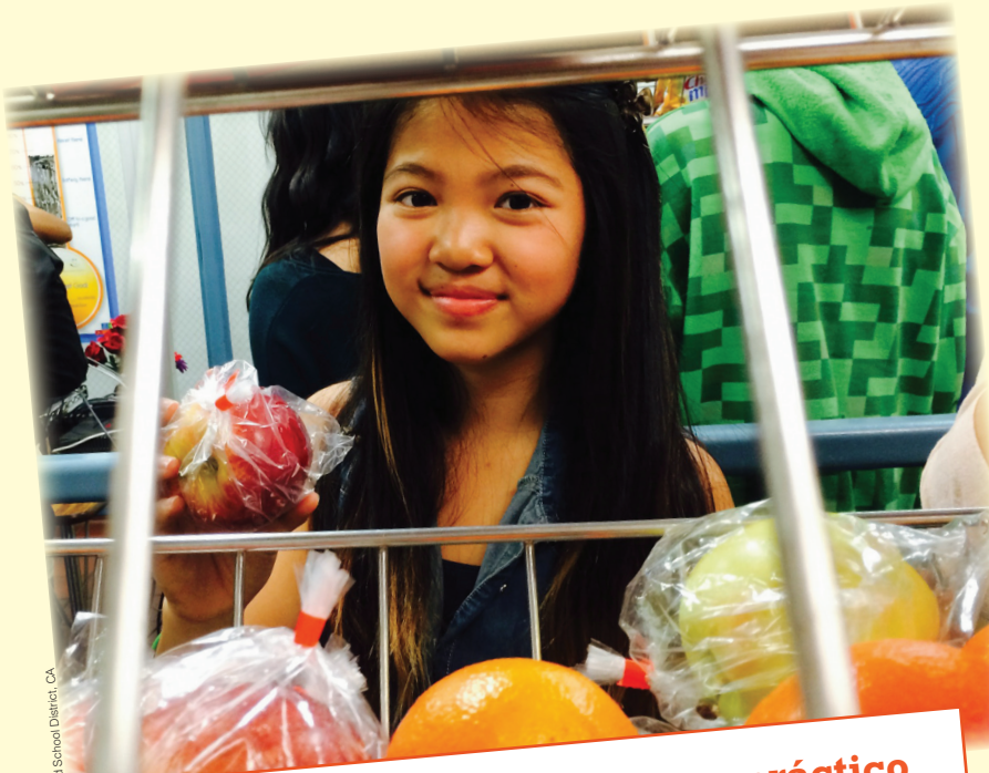
Irvine Unified School District, CA

Ahorre tiempo en las mañanas. ¡Aproveche los desayunos escolares! Del 7 al 11 de marzo de 2016 se celebra la Semana Nacional de Desayunos Escolares. Nuestro distrito está celebrando el programa de desayunos escolares con la campaña “Despierta para tomar el desayuno escolar”. Comuníquese con el administrador de la cafetería de la escuela de su hijo(a) para obtener más información sobre los desayunos que se ofrecen.