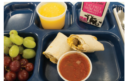
Barnidj Area Schools, MN

Para obtener más información acerca del programa de desayuno escolar, visite www.schoolnutrition.org/SchoolMeals o www.facebook.com/TrayTalk .